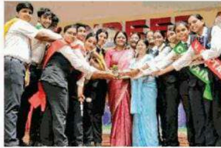
ज्ञान दीप एकलोक चितईपुर वाराणसी में गुरुजनों को सम्मानित करते विद्यार्थी।