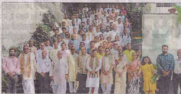
बीएचयू के अंतर विश्वविद्यालय अध्यापक शिक्षा केंद्र में गुरुवार को आयोजित शिक्षक दिवस समारोह में शामिल विशिष्टजन।