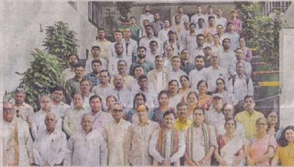
विश्वविद्यालय अध्यापक शिक्षा केंद्र में सम्मानित शिक्षक व अधिकारी