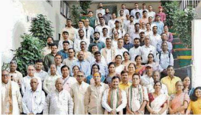
विश्वविद्यालय अत्यापक शिक्षा केंद्र में सम्मानित शिक्षक व अधिकारी। अमर

कार्यक्रम एक शैक्षिक संगोष्ठी के रूप में था जिसका टैगलाइन विकसित भारत @2047 शिक्षा और शिक्षक की भूमिका थी।