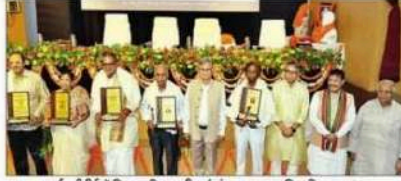
आईयूसीटीई में शिक्षक दिवस की पूर्व संध्या पर सम्मानित शिक्षक।